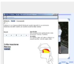
Un esempio tratto dalla Fonetica

LO: • Plugin Sun Java Runtime (vers. 1.4.0 o sup.) • Javascript abilitati • Acrobat Reader (vers. 5 o sup.)