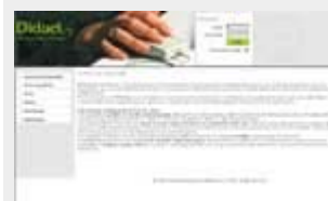
L'ambiente di e-Learning Dentro l'Italiano WLE

Didael KTS Knowledge Technologies Services