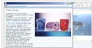
Un esempio di Approfondimento